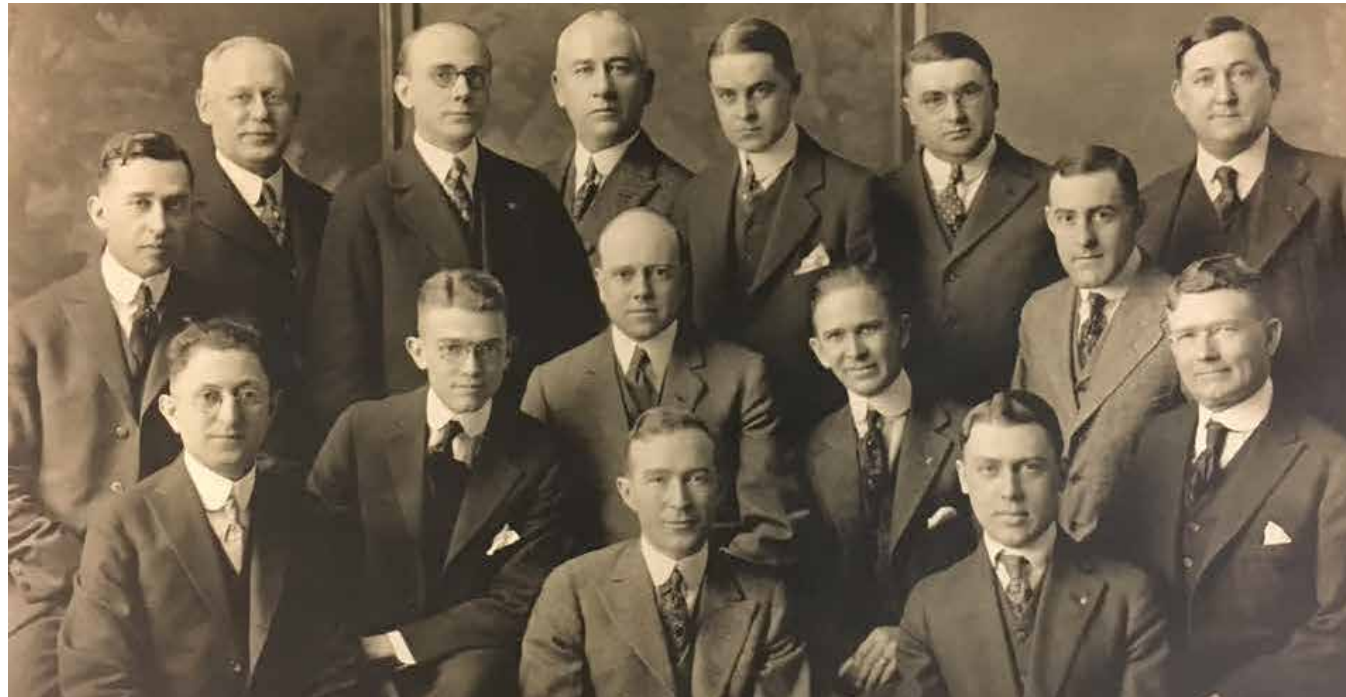
Les membres fondateurs du club Optimist d'Indianapolis, dans l'Indiana, en 1916

L'organisation Optimist International a été fondée lors d'un congrès à Louisville, dans le Kentucky, en 1919, réunissant divers clubs locaux et régionaux, dont le premier avait été fondé à Buffalo, dans l'État de New York, en 1911. Lors de cette convention, la première charte officielle de l'organisation internationale a été attribuée au club du centre-ville d'Indianapolis, dans l'Indiana, fondé en 1916.